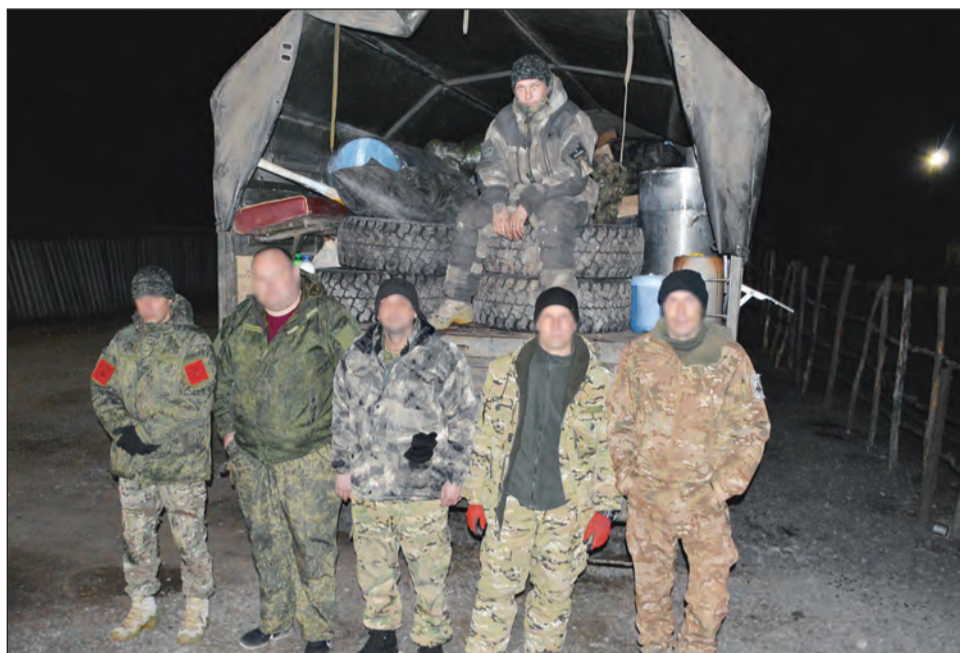
Бойцы на передовой получают помощь вовремя

— В течение недели ко мне домой привозят гуманитарную помощь предприниматели, фермеры, жены и родственники мобилизованных военнослужащих из Воронежа, Лисок, Острогожска, Россо-