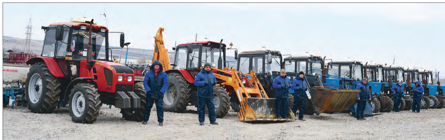
■ Вся техника, имеющаяся в хозяйстве, находилась на линейке готовности

Завершившаяся проверка подтвердила, что все самоходные машины можно использовать в работе