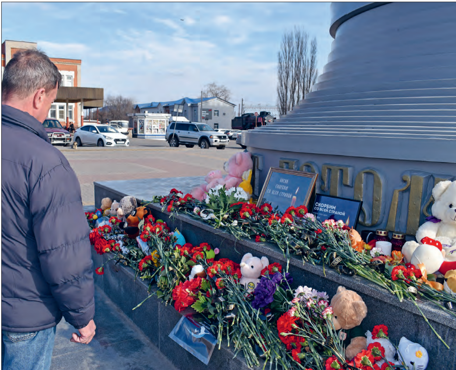
■ Стихийные народные мемориалы появились во многих населенных пунктах нашей страны

Хроника событий недели после террористического акта в здании концертного зала «Крокус Сити Холл»