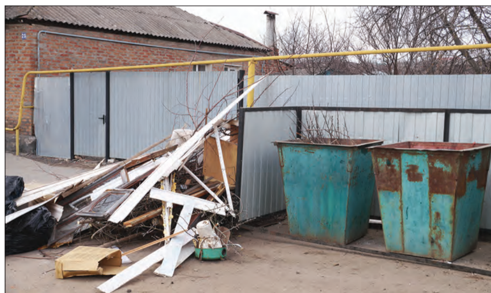
■ Крупногабаритные отходы не должны находиться рядом с контейнерами для обычного бытового мусора

Вывоз таких отходов осуществляется по согласованному заранее графику либо по заявке управляющей компании,