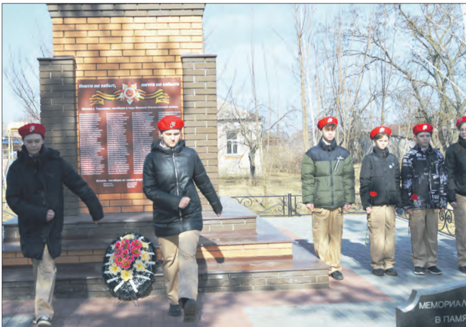
Юнармейцы Терешковской школы и гости возложили цветы и венки к подножию памятника

Мемориальную плиту установили в память о жителях села, расстрелянных в июле 1942 года