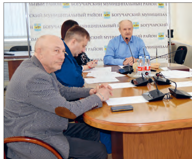
■ На приеме в формате ВКС рассматривались вопросы жителей Богучарского района