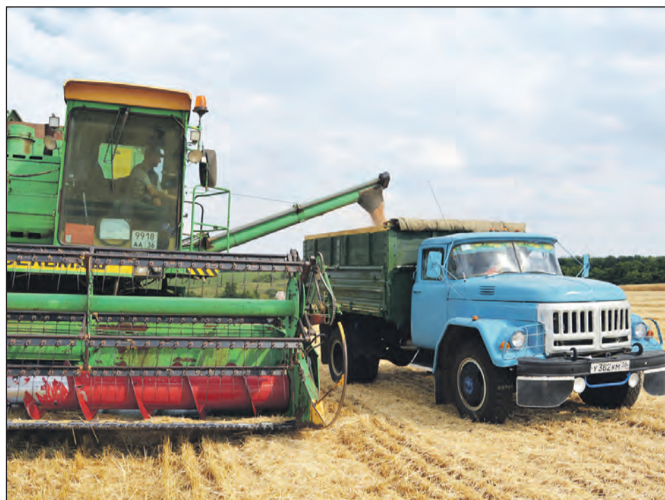
Урожай зерновых культур в 2022 году уродился на славу

В апреле 2022 года учреждения культуры Богучарского района успешно приняли участие в творческом смотре культурно-досуговых учреждений муниципальных образований Воронежской области «Дом культуры. Шаг в будущее». Просмотровая комиссия департамента культуры и областного центра народного творче-