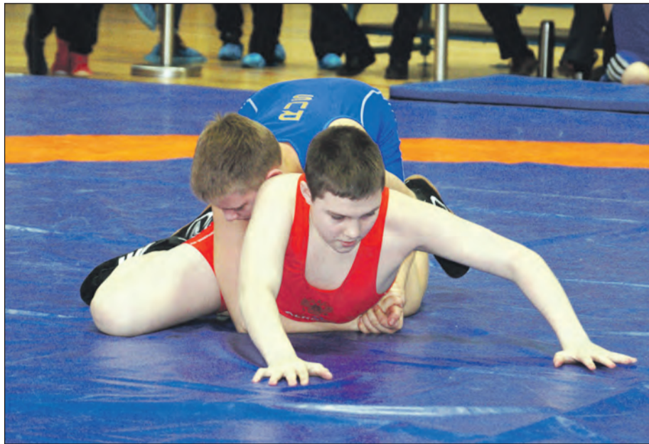
Юные борцы демонстрируют борьбу в партере