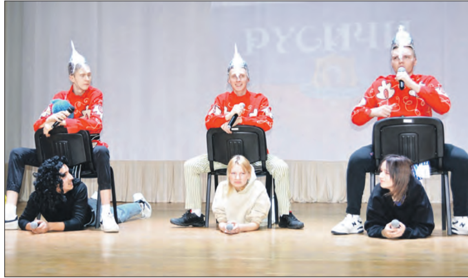
■ Команда «Русичи» заочно выступила с домашним заданием

На протяжении игры команды удивляли зрителей и жюри остроумием шуток, интересными сценками, смешными миниатюрами и актерским мастерством. А пока счетная комиссия подводила итоги каждого конкурса, своими выступлениями всех радовали солисты районного Двор-