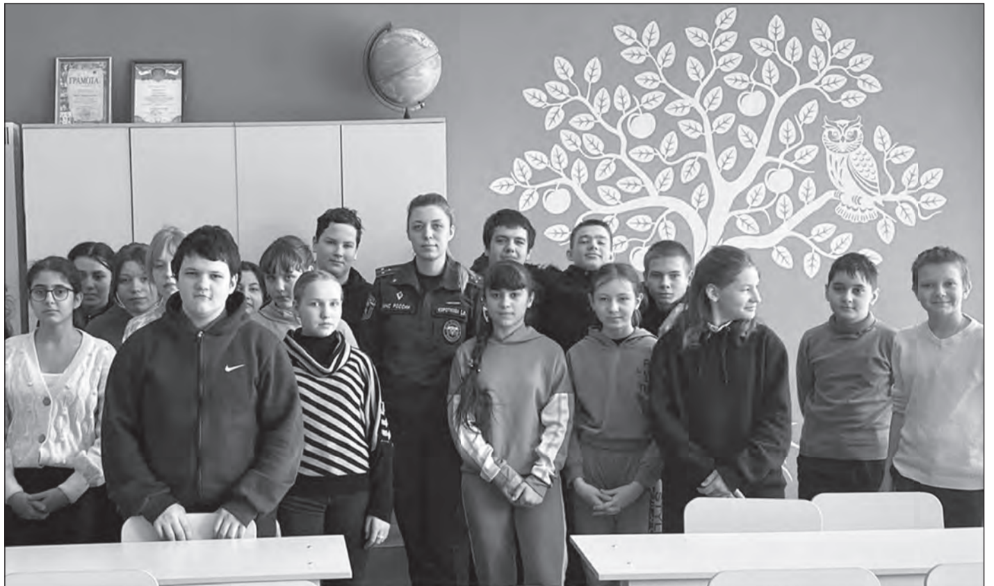
Школьники узнали, что в случае пожара нужно звонить по телефону «101»