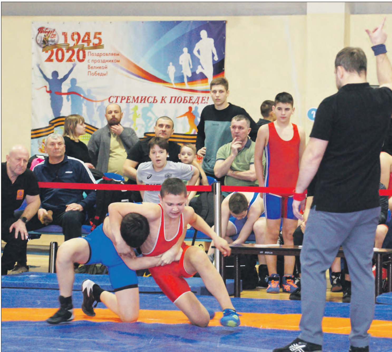
Удачно проведенный бросок, как правило, залог победы в борцовском поединке

Молодые борцы из Богучара стали лучшими в разных весовых категориях