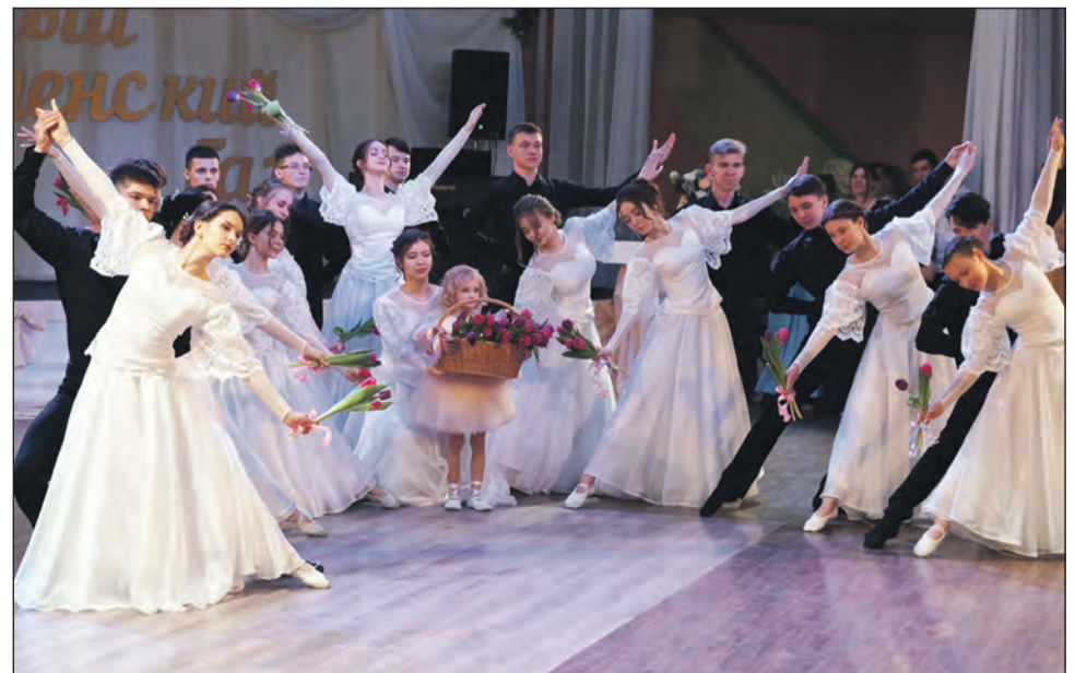
■ Танец исполнили ученики Богучарской школы №1, лицея и студенты колледжа

Татьяна ПОДЛИПАЕВА