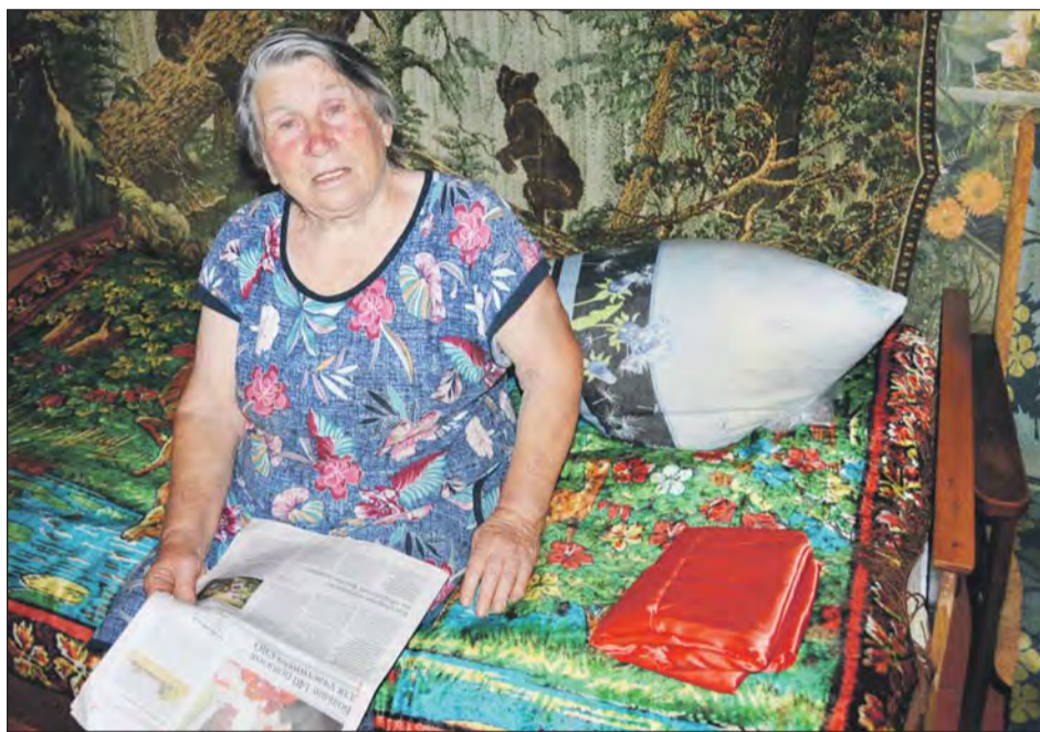
■ Сельчанка, прочитав заметку в «СН», решила тоже поддержать российских военнослужащих

— Я, как получаю пенсию, собираю посылочку. Стараюсь покупать необходимые в обиходе вещи, конечно же, что-