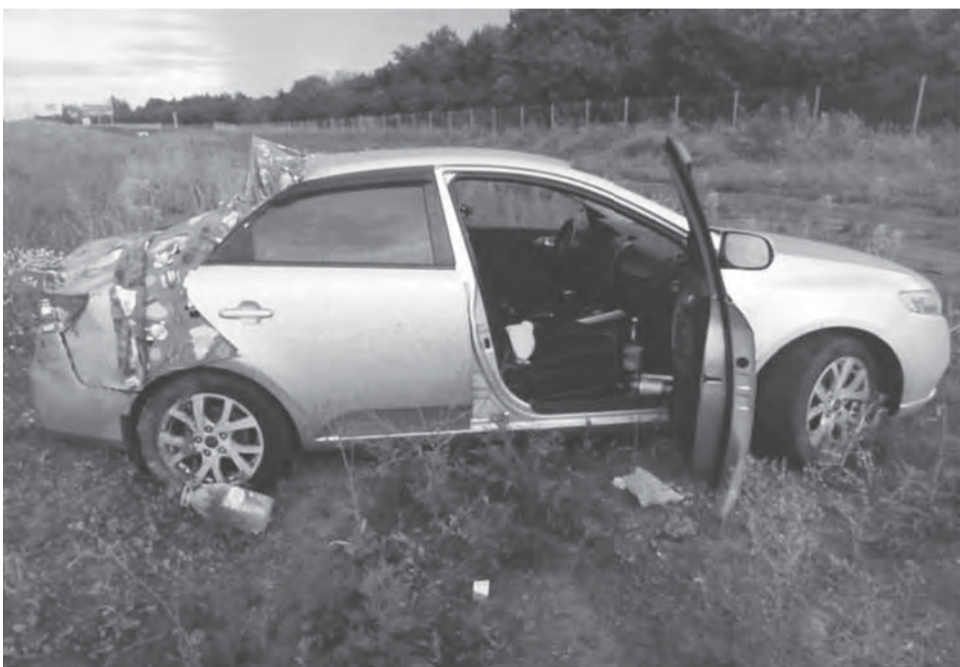
■ Автомобиль съехал в кювет и перевернулся

Водитель KIA Cerato не справился с управлением