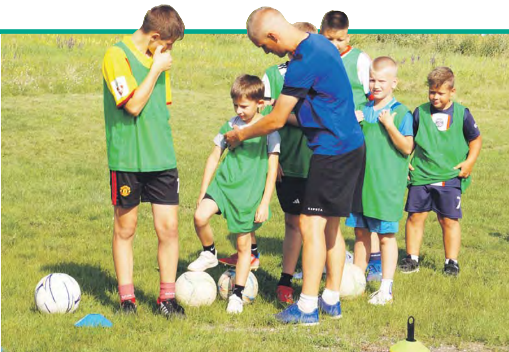
С жителями четырех сел района занимаются инструкторы по спорту