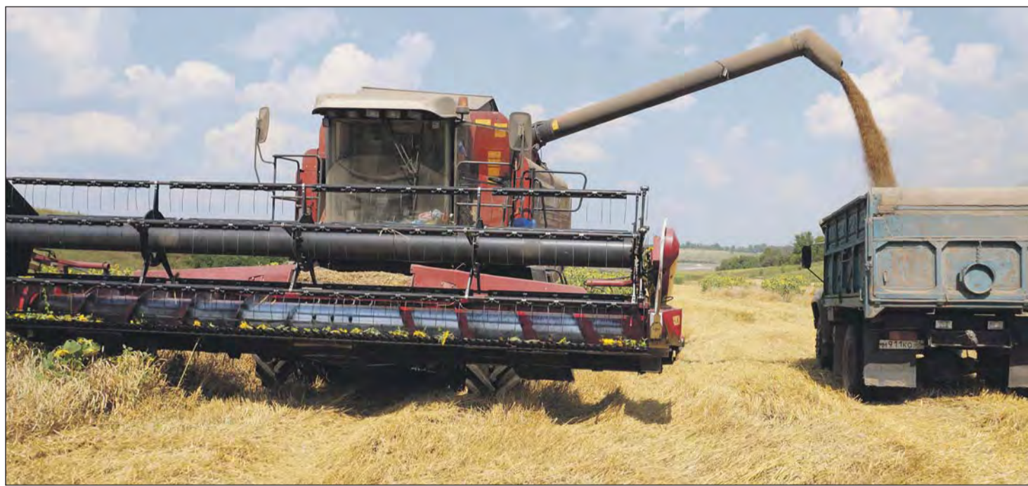
■ Завершение уборки ранних зерновых культур в твердохлебовской сельхозорганизации