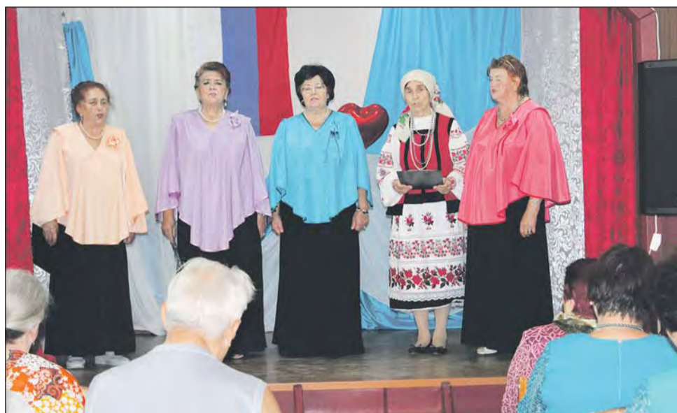
■ На сцене — ансамбль «Родные напевы»

Праздничное настроение зрителям давали творческие коллективы: вокальный ансамбль «Надежда» Филоновского сельского Дома культуры, вокальный ансамбль «Зоренька» Купянского сельского клуба, народный фольклорный ансамбль «Черешенка» и вокальный ансамбль ветеранов «Родные напевы» Дома культуры ветеранов, которые представили свои лучшие номера.