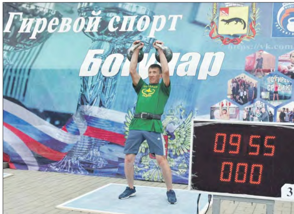
■ Богучарские гиревики регулярно становятся победителями и призерами различных соревнований

— За последние пять лет в нашем районе заметно вырос интерес к спорту, в том числе и в подростковой среде. Это напрямую связано с увеличением числа спортив-