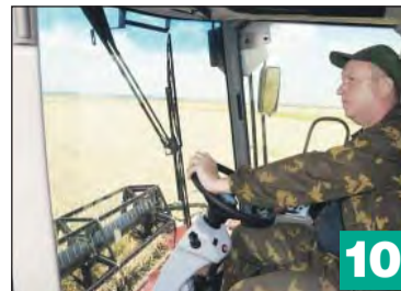
Богучарские полеводы справились с уборкой ранних зерновых культур