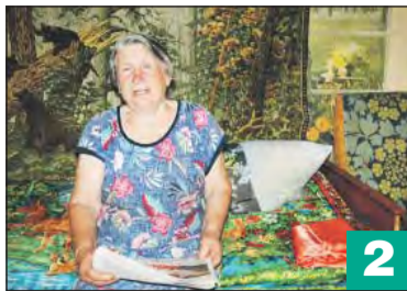
Жительница Монастырщины помогла участникам СВО