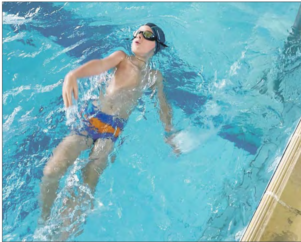
■ Плавание — самый молодой вид спорта в районе

Самый большой вклад в развитие физической культуры и спорта в районе вносит Богучарская спортивная школа. В этом году исполняется ровно 45 лет с момента ее открытия. За эти годы здесь прошли спортивную подготовку тысячи богучарских подростков. Сейчас здесь занимаются около