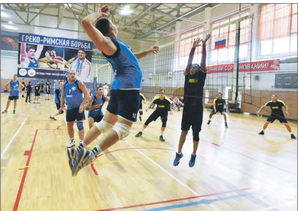
В районе насчитывается около десяти волейбольных команд

Владимир ГЕРУСОВ Фото автора, из архива «СН» и спортивной школы