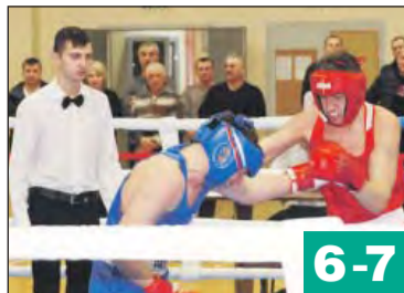
Как в районе развиваются физическая культура и спорт