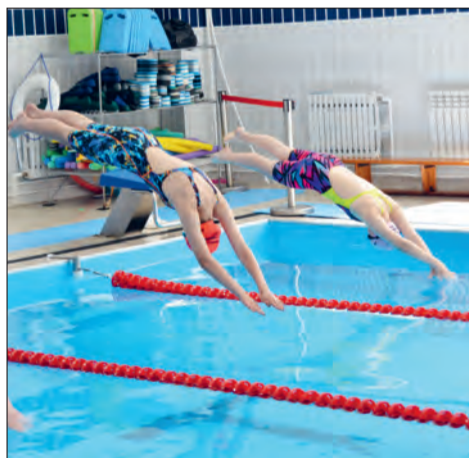
■ Заплыв девушек на дистанции 100 м комплексным плаванием