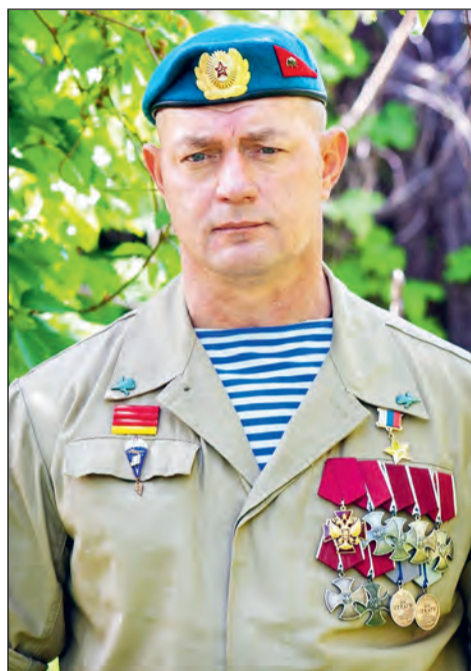
■ Наш земляк — Герой России

— С 2008 по 2014 годы я служил по контракту в одном из подразделений специального назначения Министерства обороны. 2 мая 2014 года по телевизору показали сюжет из Украины, когда в Одес-