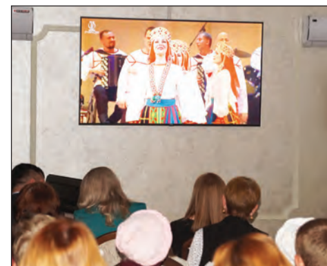
■ Первая трансляция в виртуальном зале