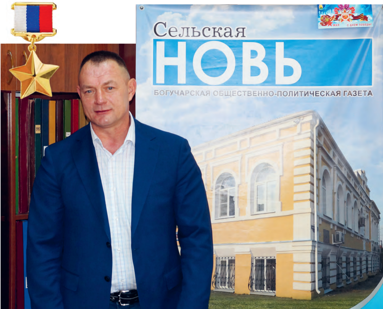
■ Легендарный воин, уроженец Богучарского района, поделился воспоминаниями о своем боевом пути

Наш земляк рассказал о своей армейской биографии, основных этапах службы на благо Родины