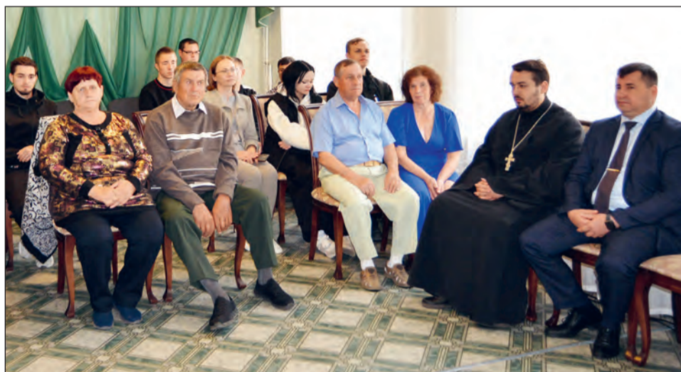
Торжественное празднование Дня семьи уже стало привычным в нашем районе

Как вы считаете, какой брак можно назвать удачным?