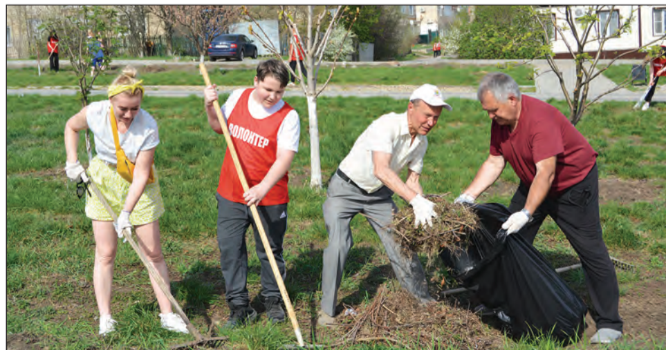
Территорию парка быстро привели в порядок