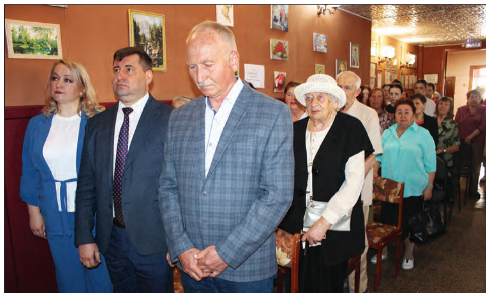
Почтили память узников фашистских концлагерей

Эта скорбная дата посвящается всем, кому пришлось пережить тяготы и лишения прошедшей войны