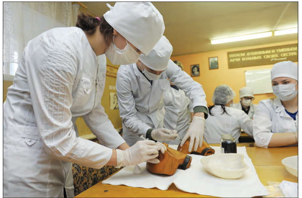
У студентов-медиков немало практических занятий