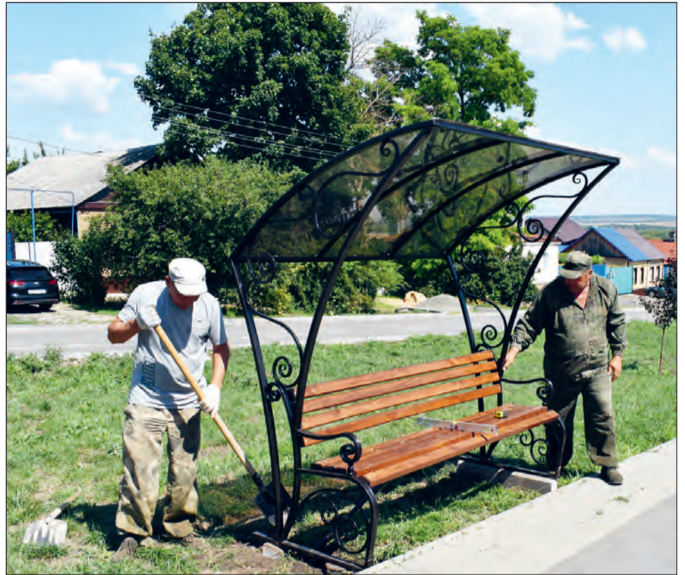
■ В сквере по улице Кирова установили новые удобные лавочки с солнцезащитными козырьками

— После их установки в городскую администрацию стали поступать просьбы от горожан, проживающих на других улицах нашего города с пожеланиями об установке таких же лавочек на улицах, где они проживают. Все просьбы и обращения горожан будут рассмотрены. Мы проработаем план по изготовлению и установке таких лавочек в других местах и городских скверах. Тем самым мы будем делать наш город более комфортным для его жителей и привлекательным для наших гостей. Это направление по благоустройству территории и комфорту граждан является для нас приоритетным и мы планируем развивать его в будущем, — пояснил Сергей Аксенов. — Особые слова благодарности хотелось бы сказать в адрес депутата Воронежской областной Думы Александра Пешикова и руководителя группы компаний «Агро-Спутник» Павла Коротунова за их помощь в транспортировке этих лавочек из Воронежа. Это было сделано на безвозмездной основе, качественно и в срок. И это не единичный случай оказания спонсорской помощи муниципалитету.