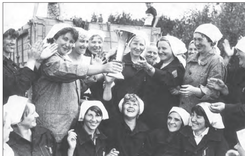
■ Твердохлебовская санитарная дружина – победитель районных соревнований. 1983 год.