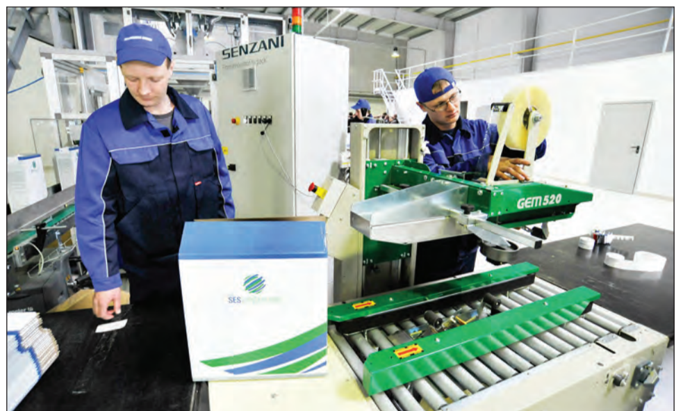
Учащиеся колледжа осваивают рабочие специальности

Ознакомьтесь со всеми доступными предложениями по целевому обучению можно на портале «Работа в России» https://trudvsem.ru/target-education/search