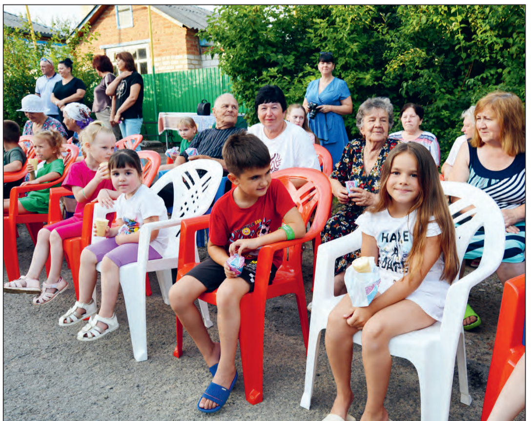
■ Все участники праздника, особенно дети, остались довольны концертом и угощениями

Праздник, организованный и проведенный активистами ТОС №10 города Богучар, продолжил в этом году добрую традицию ежегодного празднования Дня улицы в нашем городе.