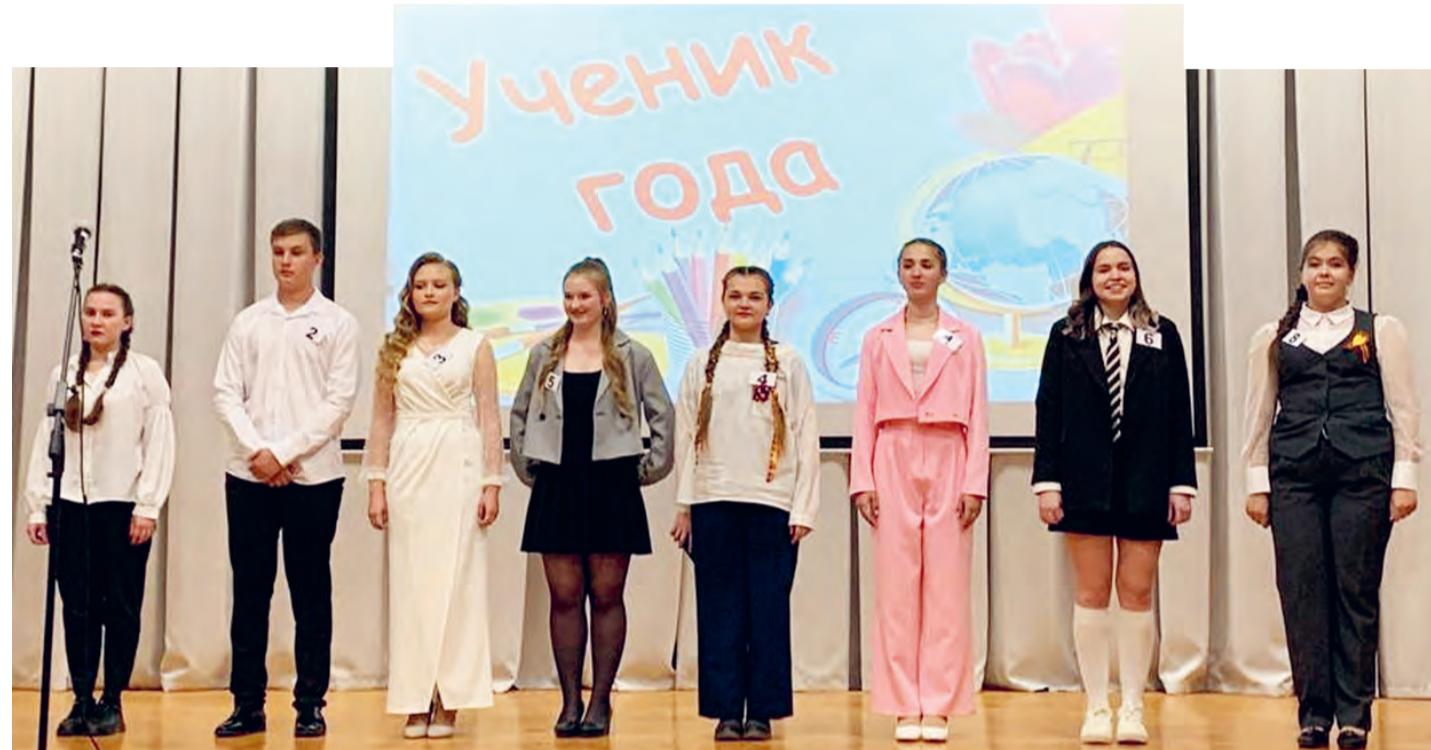
Финалисты конкурса «Ученик года-2024» готовы к испытаниям

Прошел финал ежегодного районного конкурса среди школьников