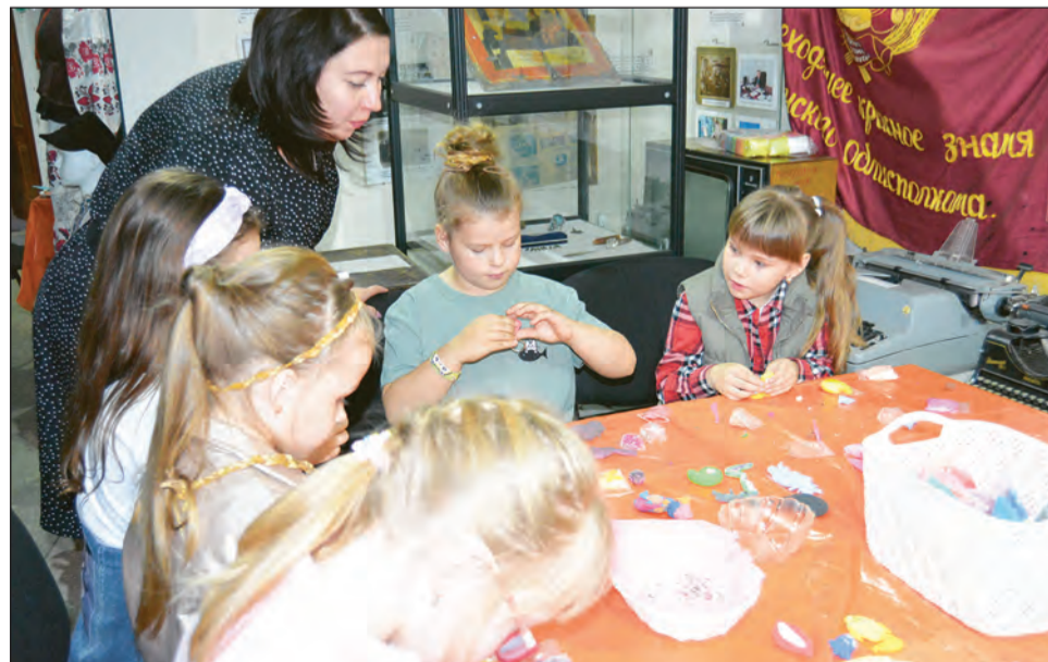
■ Младшие школьники увлеченно работали с воздушным пластилином