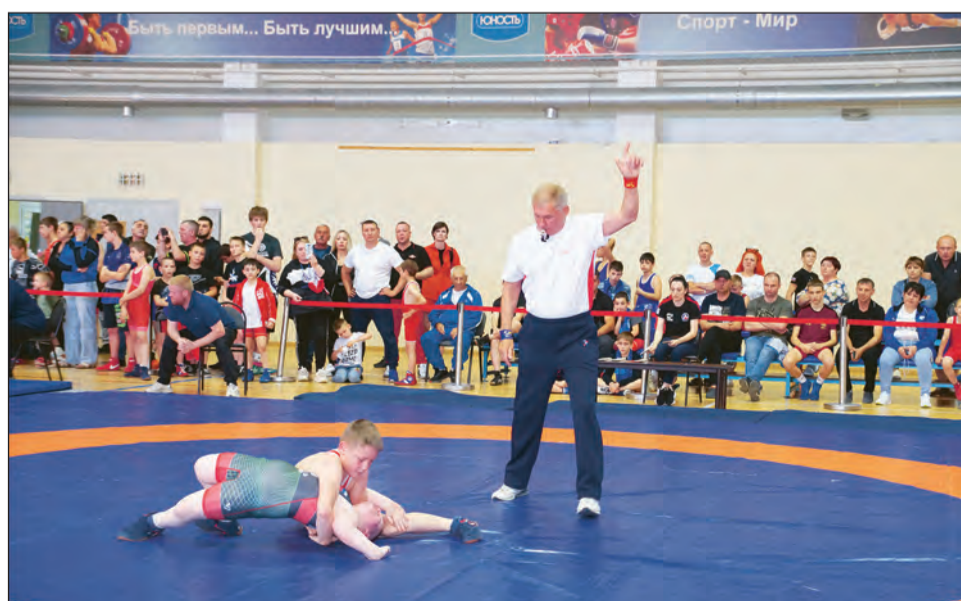
■ Самые юные участники соревнований показали бескомпромиссную борьбу