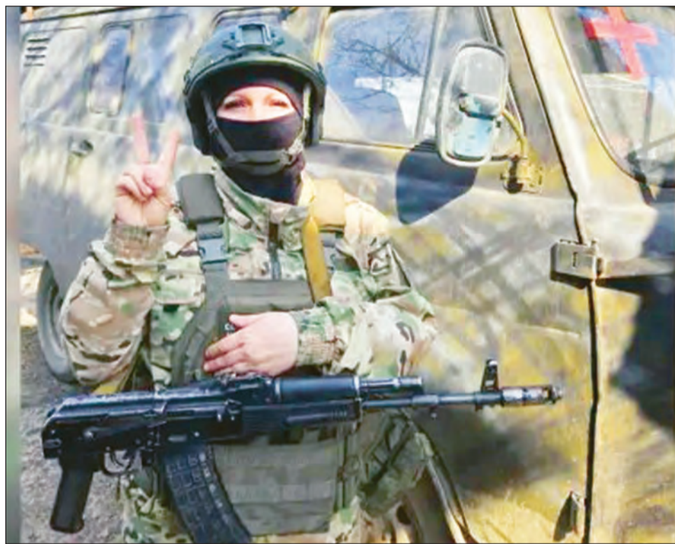
■ На СВО Надежда оказывает медпомощь нашим бойцам

Как жительница Воронежской области получила новую специальность и отправилась на СВО