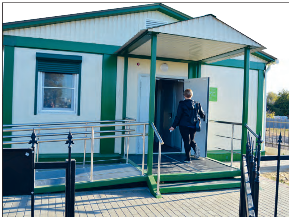
■ ФАП в Красногоровке построен по региональной программе

В 2023 году в рамках проекта «Профессионалитет» область получила 330 млн рублей из федерального бюджета. С привлечением средств предприятий и областного бюджета на базе учреждений среднего профессионального образования создали четыре образовательно-производственных