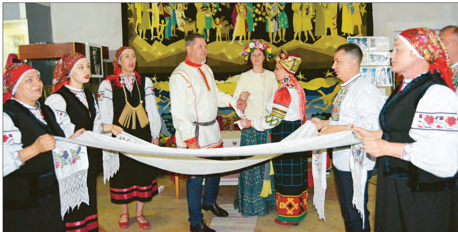
■ Традиционный свадебный обряд богучарщины конца XVIII века

В Богучаре прошло культурное мероприятие в рамках ставшей традиционной Всероссийской акции «Ночь музеев»