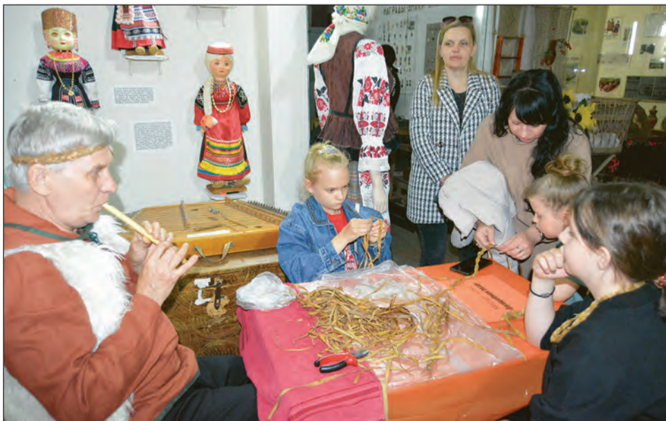
■ Во время мастер-класса по плетению из лозы звучала камышковая дудочка